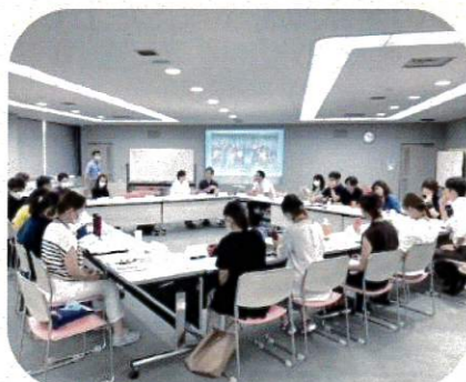
今年度の中区・南区合同での企画会議の様子