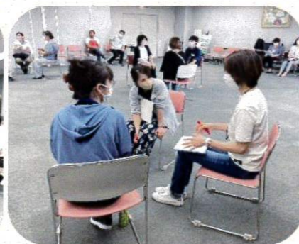
『令和5年度 南区で協働をすすめるためのソーシャルワーク研修』の様子