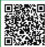
地域福祉研修情報ネット QRコード

具体的には、研修の企画・実施・評価及び、堺市民・堺市内の福祉関係者等が受講できる研修情報を掲載・閲覧できるポータルサイト「地域福祉研修情報ネット」の運用をしています。