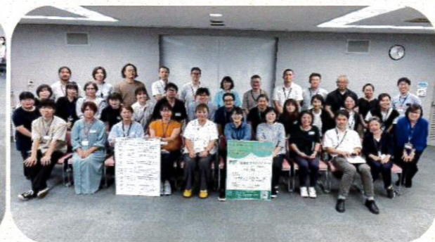
『令和5年度 南区で協働をすすめるためのソーシャルワーク研修』最終日2日目の集合写真