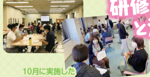
10月に実施した 西区研修の様子