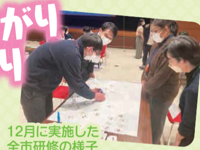
12月に実施した 全市研修の様子