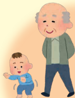
孫の世話をしながら、 配偶者の介護をされている方