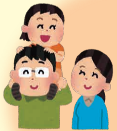
子育てしながら、 親の介護もされている方

「ダブルケア」をご存じですか? 「ダブルケア」とは「子育て」と「介護」を同時期に行っている状態のことです。子どもや孫のお世話をしながら配偶者や親の介護もされている方をいいます。どちらか片方でも大変なことですが、その両方となるとさらに大きな労力がかかります。どちらも担うことは当たり前のことではありません。基幹型包括支援センターではダブルケアをしている方の相談窓口を設けています。心当たりがありましたら、お気軽に相談してください。