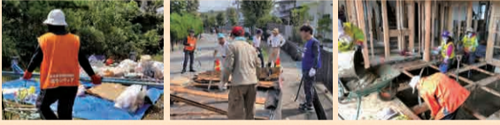
家財道具の運搬・清掃・泥出しなど