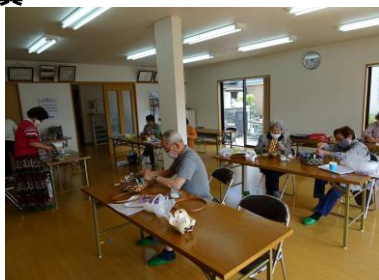
(ふれあいサロンファミリー)