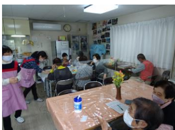
(ふれあい喫茶(校区ボランティアビューロー))