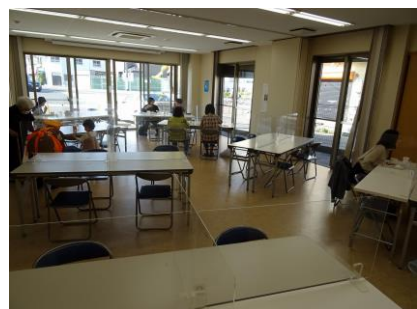
(ふれあい喫茶やすらぎ)