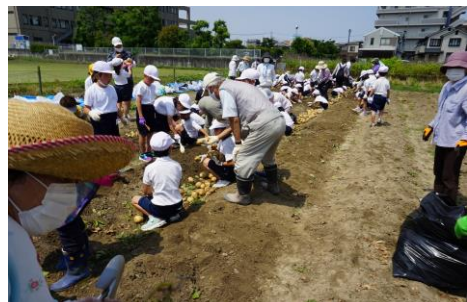
(世代間交流(じゃがいも収穫))