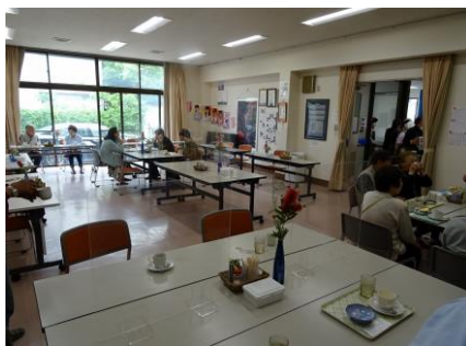
(ふれあい喫茶 サロンさくら)