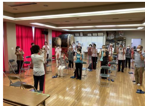
(地域リハビリ お楽しみクラブ)