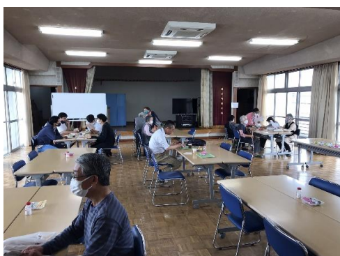
(陵南ワイワイサロン)