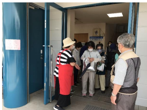
(お弁当テイクアウトイベント)