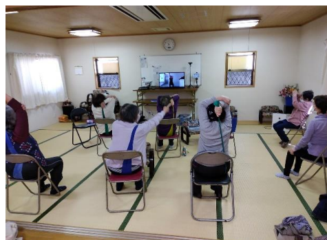
( 一二三会 健康体操 )