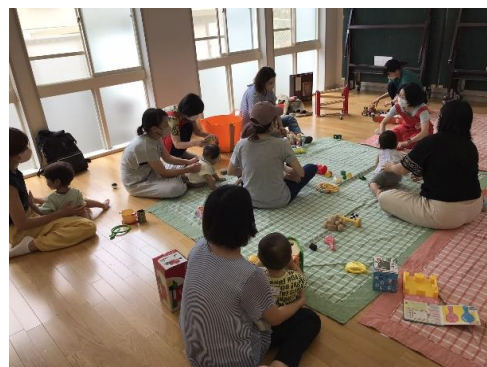
(ちびちゃんず・ベビーちゃんず)