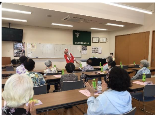
(いきいきもずの会)