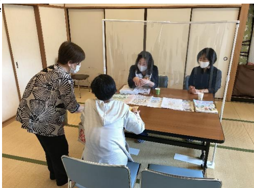
(ちょこっと寄り合い所)