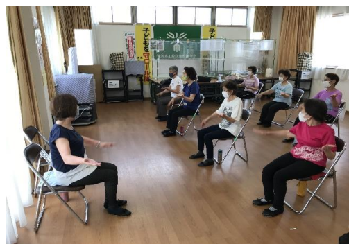
(スマイル健康体操)