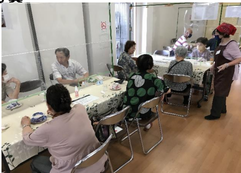
(プレミアムカフェ)