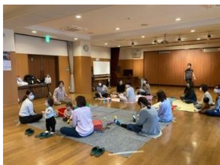
(長曽根町どんぐり広場)