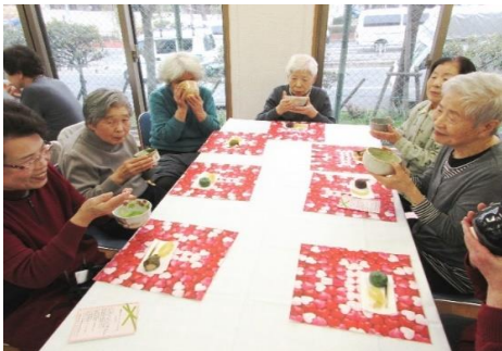
サロン・ド・エバラ (いきいきサロン)