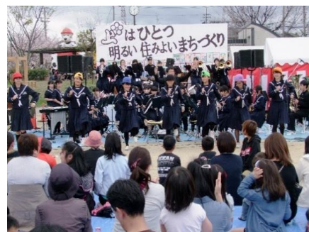
桜祭り～地域住民の交流～