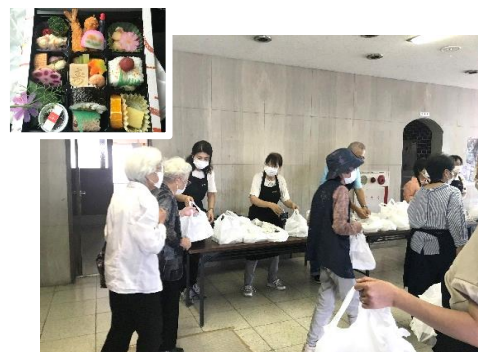
一人暮らし高齢者食事会