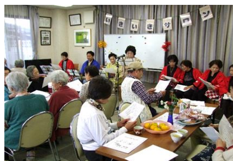
ふれあいいきいきサロン