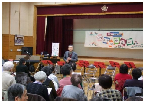
津久野校区合同いきいきサロン