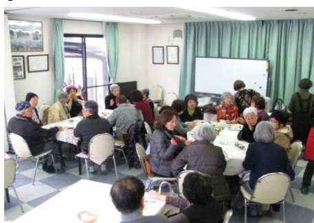
モーニングカフェ・松ぼっくり