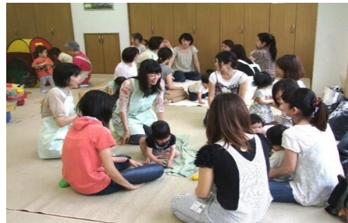
子育てサークル ピッコロ