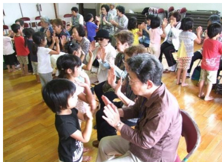
いきいきサロン おしゃべり会