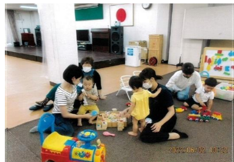
子育て広場 ぽっぽ