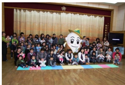
子育て支援サークル つくの