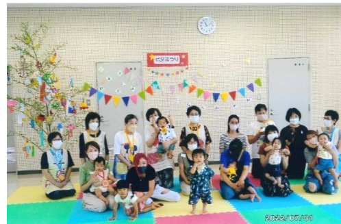
子育てひろば いっしょにあそぼ