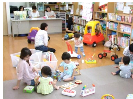
子育てサロン「おもちゃ図書館」