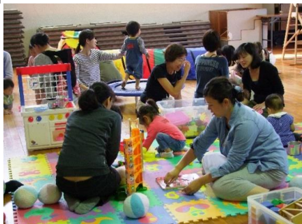
子育てサロン(浜寺石津にここ広場)