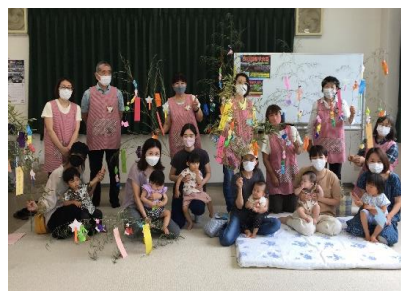
子育てサロン「コアラ」