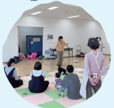
中区 子育てサロン