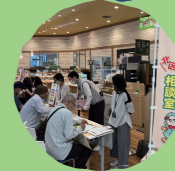
北区 まちかどつながり相談室