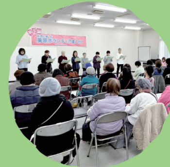
美原区 ボランティアまつり

社会福祉協議会(略称「社協」) は… 地域福祉を推進する営利を目的としない公共性の高い民間組織です。社会福祉法に基づき全国的に設置されています。