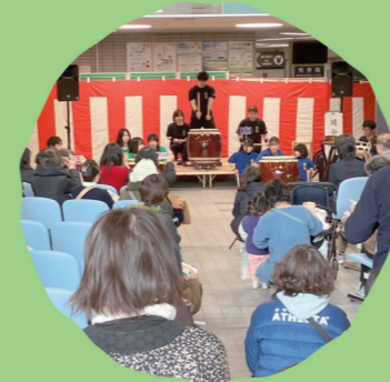
南区 ボランティアフェスティバル