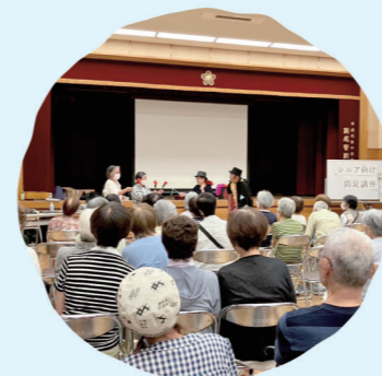
西区 シニア向け防災講座