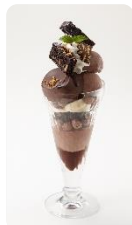
DEVIL'S フラウニーサンデー