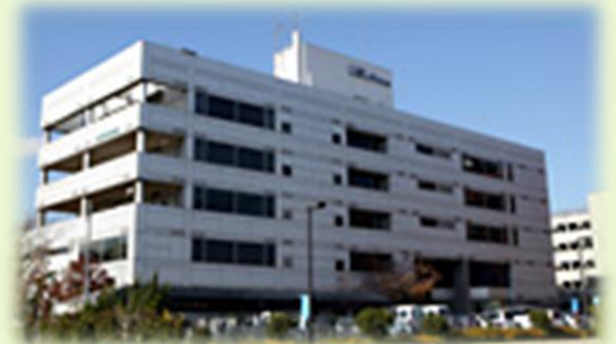
堺市産業振興センター外観

◎南海高野線中百舌鳥駅北出口より約300m ◎Osaka Metro御堂筋線なかもず駅8番出口より約300m ※駐車場は、隣接の来客用駐車場(無料)がございますが、 できるだけ電車・バスなどの公共交通機関をご利用ください。