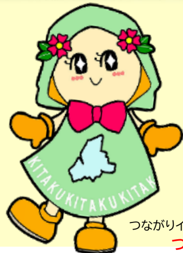
つながりイメージキャラクター つなぎー