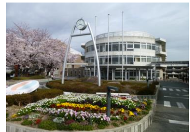
医療法人杏和会 阪南病院