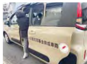
今年度の助成金を活用し購入された車両で利用者送迎などに役立てられています。