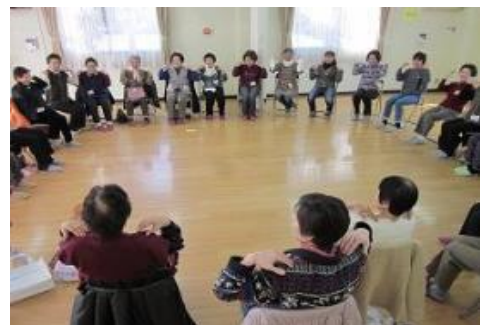
いきいきサロン「わくわくクラブ」