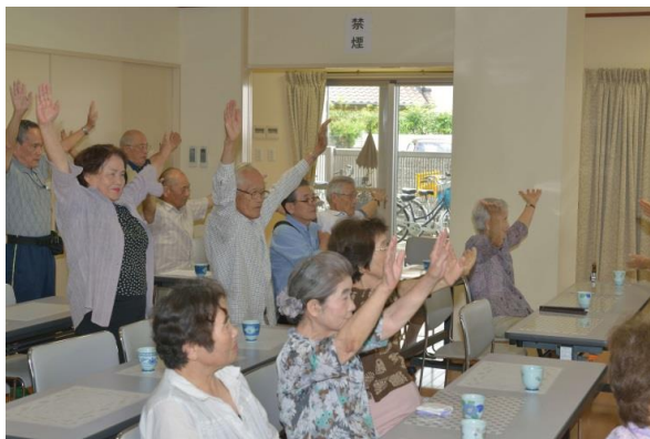
いきいきサロンひまわり会