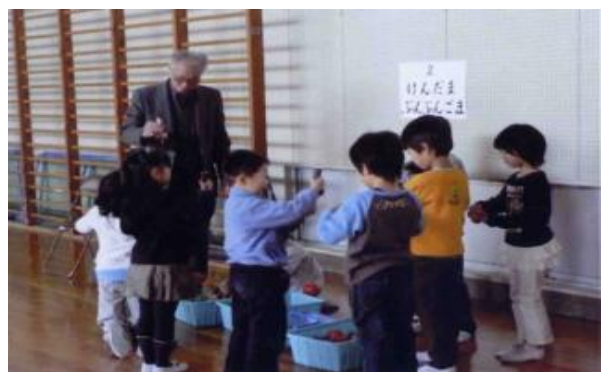
世代間交流 ~1年生昔の遊び・けん玉~