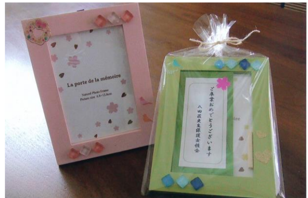
卒業記念写真立て