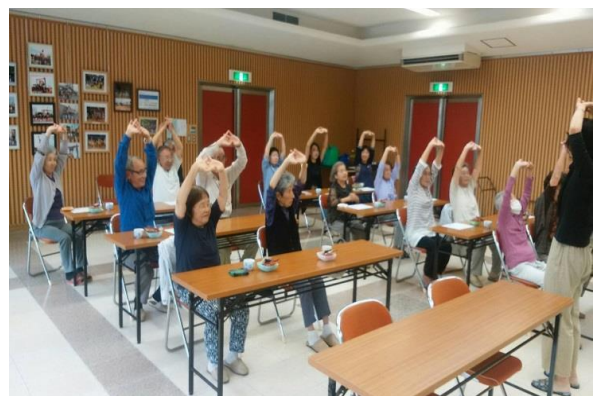
いきいきサロンなごやか新家