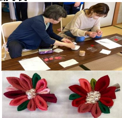
いきいきサロン「手芸：つまみ細工ブローチ」