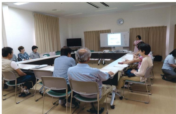
ビューローでの健康教室