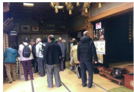
散策マップ(観音寺本堂にて)