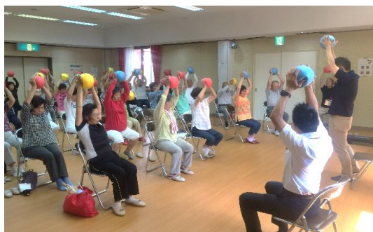
福田フィットネス