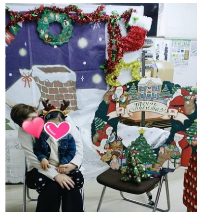
子育て支援：記念撮影会