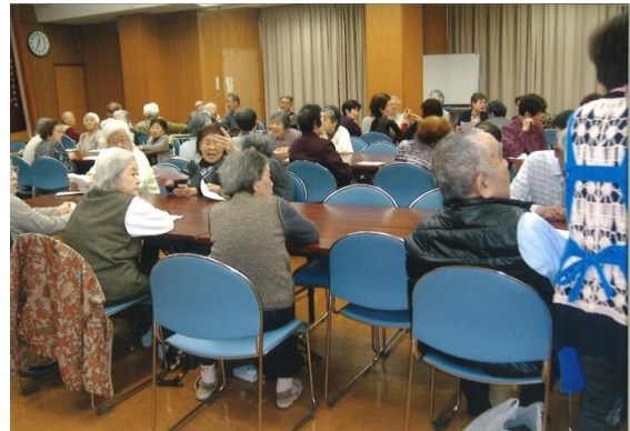
ふれあいの集い・深井清水会館