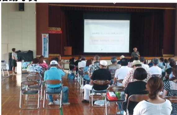
社会を明るくする運動 ~老人と自転車通行、交通規則の説明~