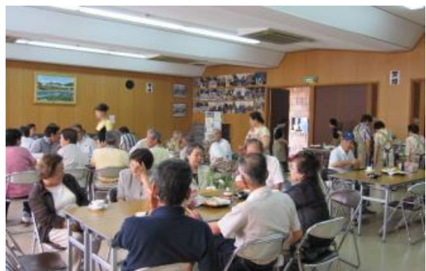
ふれあい喫茶の様子(水池会館)