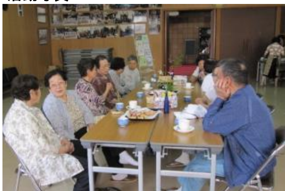
美味しいコーヒーに会話もはずみます