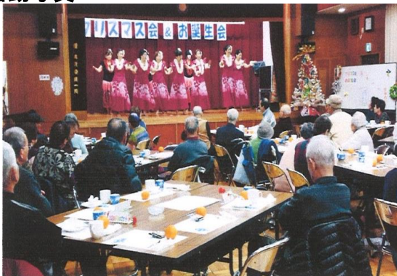
ふれあいの集いクリスマス会・深井中町会館