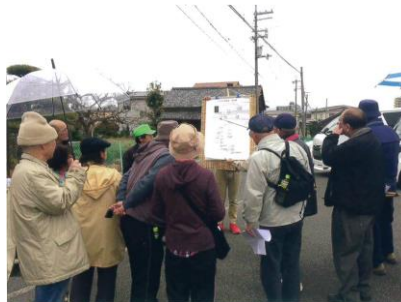
散策マップ(語り部の案内)