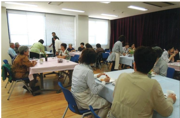
いきいき喫茶・茶菓をまじえて交流