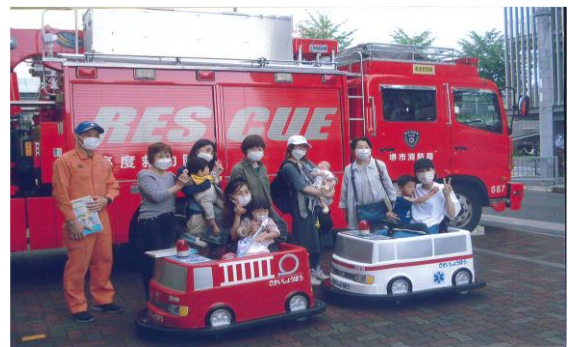
子育てサロンで消防施設を見学