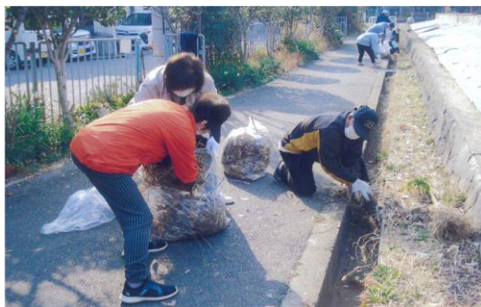
公園愛護委員と一緒に通学路清掃